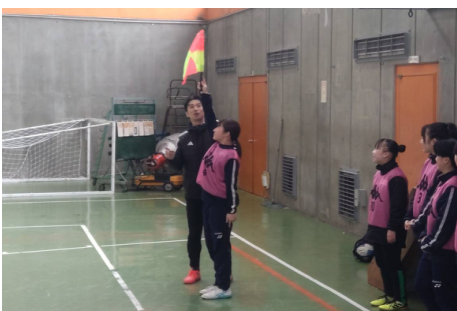
旗を上げるときの腕の角度や、腕をしっかり伸ばすことで、かっこよく見えます。