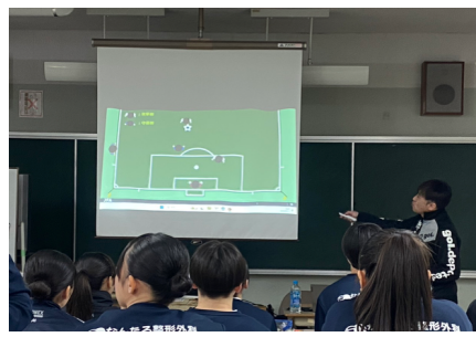
オフサイドについて、知っているようで知らなかったことも多かったようです。