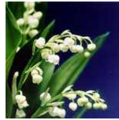
札幌市の花 ライラック

主 催 公益財団法人北海道サッカー協会 一般社団法人北海道フットサル連盟 北海道自治体職員サッカー連盟 主 管 一般社団法人札幌地区サッカー協会 特定非営利活動法人北海道フットサル連盟 期 日 2026年1月24日(土)・25(日) 会 場 札幌市清田区体育館