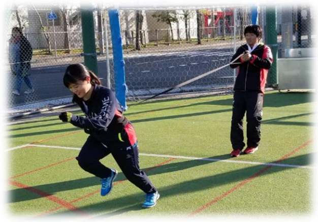
ハーネスを用いたスピードトレーニングを体験