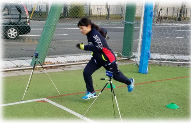
40m スプリントテストを体験。高い基準をクリア！