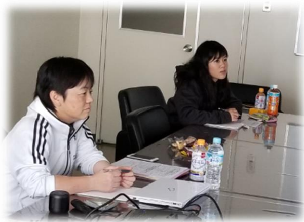
フィットネスについてのプレゼンを受講しました