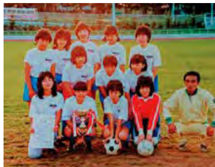
北海道初の女子サッカーチーム「美香保リーボンズ」

盟の中に女子担当が設けられました。このとき、担当者として声をかけていただいたことが、現在までフットサルに関わり続けるきっかけとなりました。