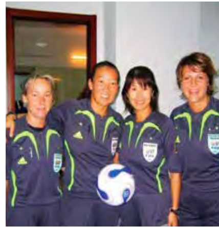
2007FIFA女子ワールドカップ準決勝

文字にすると順調にキャリアを重ねたように見えますが、恩師の言葉どおり、前例のないものへのチャレンジばかり。同じ経験をしている仲間も、悩みを共有できる仲間もなく、先の見えない道に悩み、苦しみ、「女性だから」という偏見との闘いの日々。安定した職や収入を得る保証もなく、実際、私が転職をした回数は、30回。そんな中でも、多くの審判指導者の方々が、勇気を持って、女性の私を起